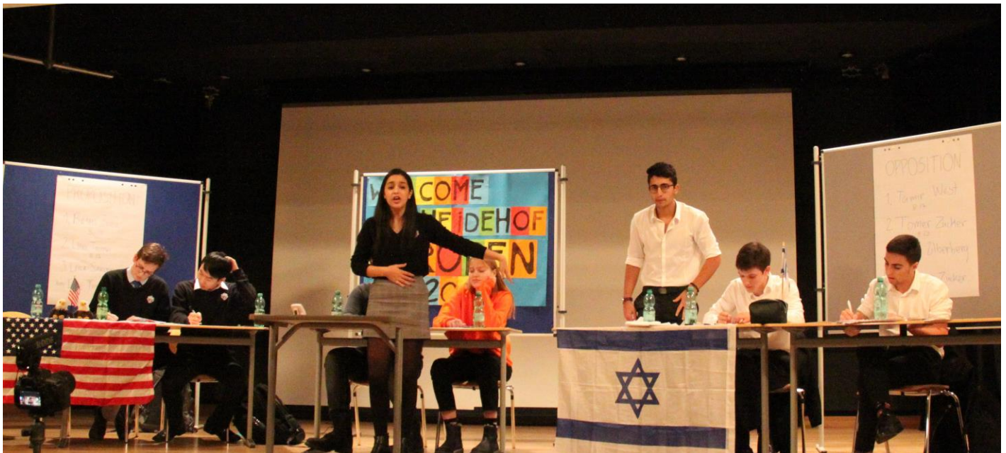
Hier: Semifinals der EurOpen 2018, USA Black gegen Israel – auf der EHG Aula-Bühne